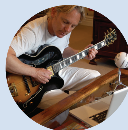
musica voce, chitarre, batteria, strumenti a corda, basso, fiati