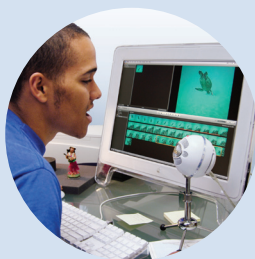
doppiaggio su video amatoriali