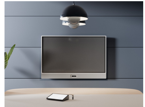
Suporte de parede com câmera na parte inferior

Criada para garantir flexibilidade, a Rally Board 65 foi projetada para se adaptar aos modos de reunião. Ela é compatível com as principais plataformas, como o Microsoft Teams, o Zoom e o Google Meet* no modo Android, PC ou Traga o próprio dispositivo (BYOD, Bring Your Own Device). A Rally Board 65 garante fácil adaptação às necessidades atuais e futuras. Além disso, ela oferece várias opções de montagem** para permitir a instalação em qualquer sala de reunião ou espaço aberto. Desenvolvida para implantação com câmera na parte superior ou inferior da tela para que cada participante mantenha contato visual natural em qualquer espaço.