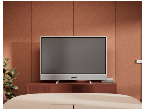
Suporte de mesa com câmera na parte inferior