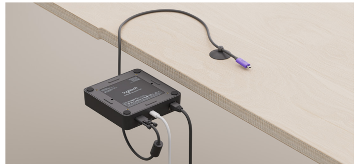
可选 USB-C 供电