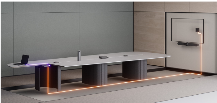
使用标准类别线缆扩展覆盖范围

通过将标准 USB-C 电源适配器连接到会议桌侧 (TX) 线盒，为笔记本电脑或移动设备提供高达 100W 的电源。