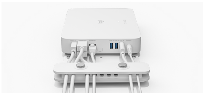
Logitech computerbevestiging afgebeeld met RoomMate

Kabelbevestigingsklem ontlast de kabels en houdt ze stevig op hun plek, inclusief USB-, HDMI-, stroom- en netwerkkabels. De tweedelige klem is verhoogd voor meer flexibiliteit en minder belasting.