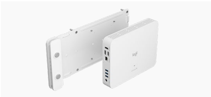
Logitech computerbevestiging afgebeeld met RoomMate

Bevestig en beveilig RoomMate of een computersysteem met behulp van de standaard VESA-bevestigingspatronen van 75 mm of 100 mm.