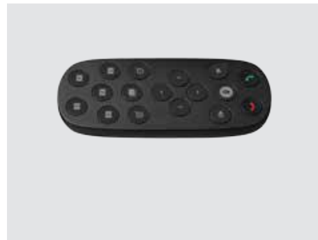
PILOT ZDALNEGO STEROWANIA